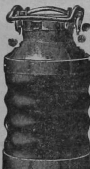
Pinturas Alabastin etc.